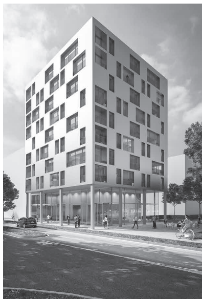
„Skaio“ Holzhybridhaus in Heilbronn

Mit dem Holzreichtum des Landes Brandenburg ergeben sich vollkommen neue Wertschöpfungsketten, was auch für das Bauen gilt. Alleine mit dem Strukturwandel in der Lausitz haben wir Brandenburger vollkommen neue Chancen. Es könnten z. B. neue Baumarten an-