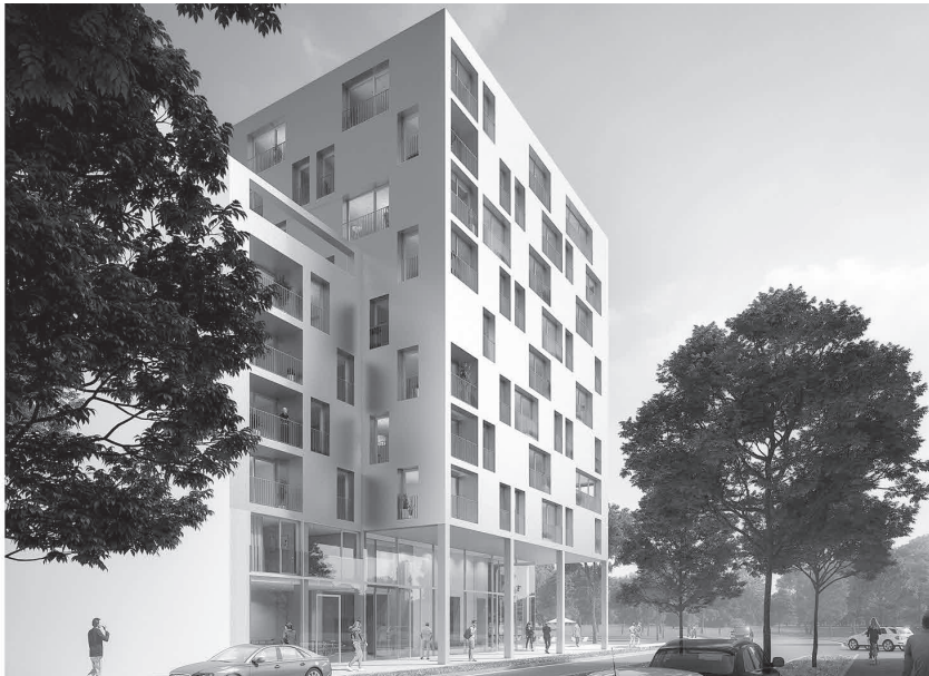
„Skaio“ Holzhybridhaus in Heilbronn

gepflanzt werden. Überhaupt könnte das Thema „Nachhaltiges Bauen auf Basis nachwachsender Rohstoffe“ auch für den Anbau von Nutzpflanzen, z. B. Hanf als Dämmstoff, auf eine neue aber einheimische Basis gestellt werden. Die Flächen sind jetzt da. Bevor wieder alles mit PV-Anlagen zugestrichelt wird. Ein solches Herangehen würde einer dezentralisierten Energieerzeugung und -versorgung entgegenwirken. Es wäre nur ein Ersatz für abgeschaltete Kraftwerke.