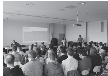
Ingenieure treffen Schule in Werder (Havel) © Daniel Petersen