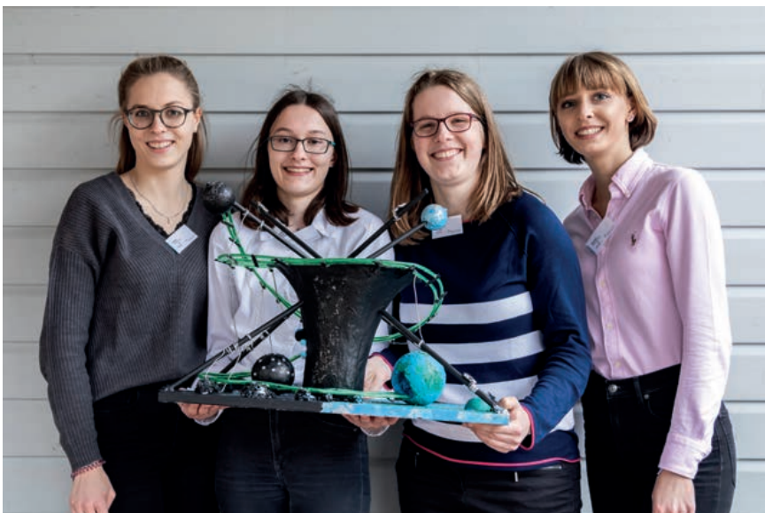
Das Gewinnermodell „Potentialtrichter“ mit seinen vier Konstrukteurinnen.