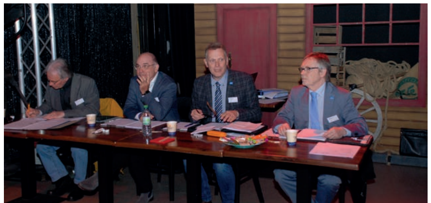
Der Wettbewerb wurde von fachkundigen Experten begleitet.