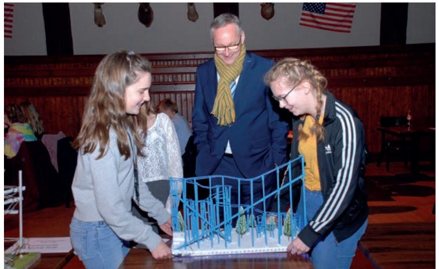
Volle Funktionsfähigkeit – ein wichtiges Kriterium für die Achterbahnen.