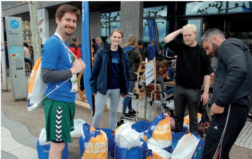
Starke Teams, starke Leistungen – so ist das bei den Ingenieurinnen und Ingenieuren