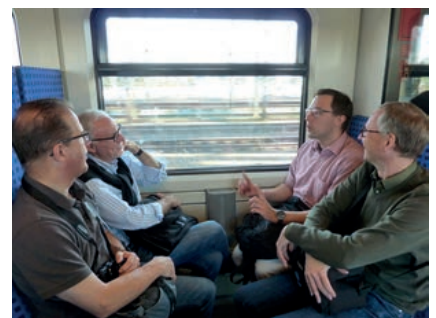
Immer wieder gerne: Die jährlichen Betriebsausflüge führen die Geschäftsstelle in alle Ecken und Winkel von NRW. Im Jahr 2016 ging es zum Drachenfels.