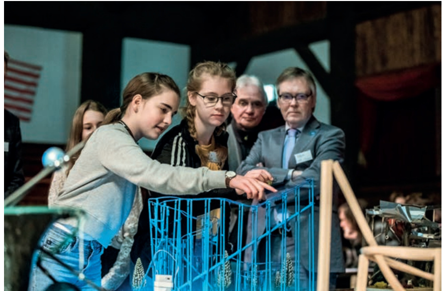
Clever konstruiert und stabil gebaut: die Achterbahnen der jungen Erbauerinnen.

Eine Achterbahn in einer Winterlandschaft: Bei den jüngeren Teilnehmern von 12 bis 14 Jahren setzte sich das Team vom Graf-Adolf Gymnasium Tecklenburg mit ihrem Modell „AME“ durch. Auf Platz 2 und 3 schafften es Teams vom Willy-Brandt-Gymnasium in Oer-Erkenschwick sowie vom Leibniz-Gymnasium Dormagen. Bei den älteren Schülerinnen und Schülern stieg eine Gruppe vom St. Franziskus-Gymnasium in Olpe (Platz 2)