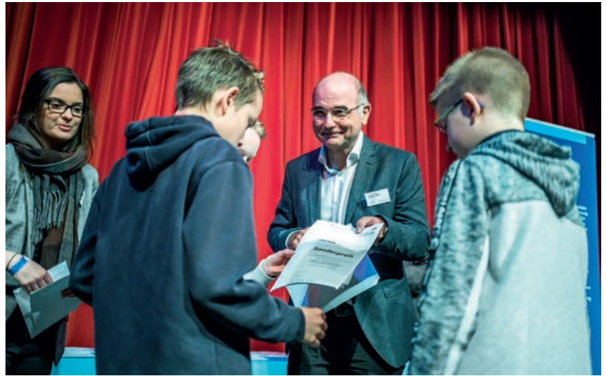
Die Preisträger aus NRW stellen sich nun dem Wettbewerb mit den Siegern aus den anderen Bundesländern.

Weitere Informationen zum Wettbewerb unter www.junioring.ingenieure.de