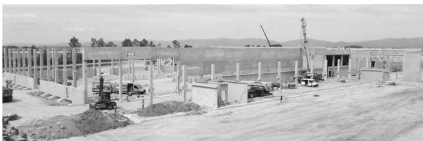
Neubau des BMW-Verteilzentrums und Ersatzteillagers in Wallersdorf (l.); Exkursionsteilnehmer (r).