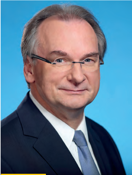
Dr. Reiner Haseloff

zum 25-jährigen Bestehen der Ingenieurkammer Sachsen-Anhalt