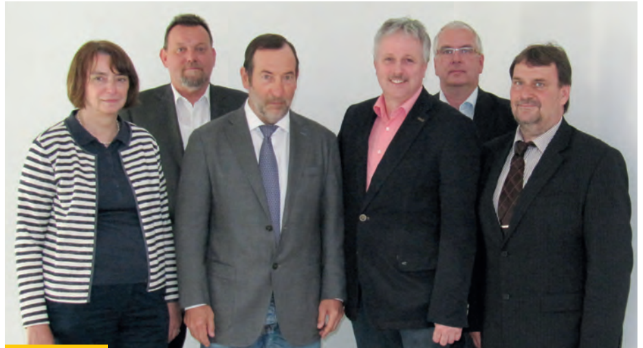
Vorstand der Ingenieurkammer Sachsen-Anhalt (v. l.):

Ganz gewiss wird sein: Die Tagesthemen diktieren unsere Aufgaben – geradeso wie