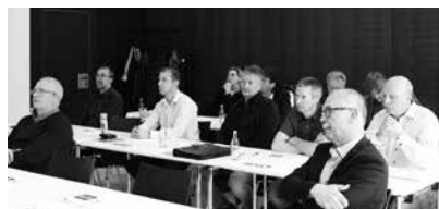
Teilnehmer der Veranstaltung

Gestaltungsmöglichkeiten sowie dem Erbrecht. Im Anschluss seines Vortrages hatten die Teilnehmer Gelegenheit, in persönlichen Gesprächen mit dem Referenten weitere Fragen zum Thema zu erörtern.