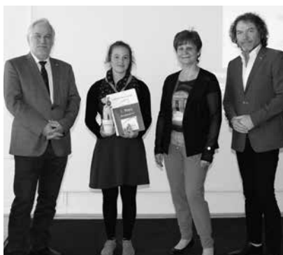
AKII 1. Preis Regelschule Steigerblick