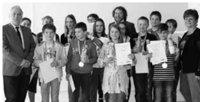
AKI 1. Preis Friedrich-Adolf-Richter-Schule Rudolstadt

rien – bis Klasse acht und ab Klasse neun – prämiert wurden.