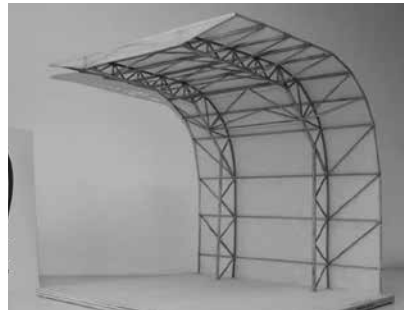
AKII 2. Preis