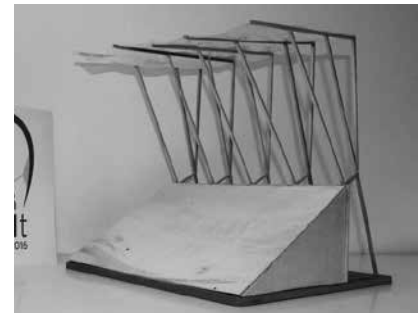
AKI 3. Preis