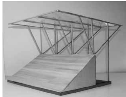
AKI 2. Preis