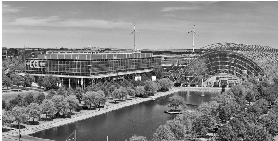
Der diesjährige Ingenieurkammertag Sachsen findet am 5. April im Congress Center Leipzig parallel zur new energy world und terratec statt.

HAUS Dresden einen Monat später vom 2. bis 5. März wiederholt.