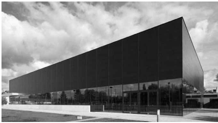
2013 ging der Sächsische Staatspreis für Baukultur an die Park Arena Neukieritzsch

Die Architektenkammer Sachsen, die Ingenieurkammer Sachsen und das Sächsische Staatsministerium des Innern loben im Jahr 2017 erneut den Staatspreis für Baukultur aus. Der Preis wird für Leistungen auf dem Gebiet der Baukultur in Sachsen verliehen. Mit dem Preis werden Bauwerke / Objekte gewürdigt, die das Niveau der Baukultur im Freistaat Sachsen heben. Die Bewertungsmaßstäbe der Jury sind dabei u. a. eine hohe Qualität der Einheit von Funktion, Gestaltung und ingenieurtechnischer Innovation sowie der ressourcenschonende Umgang mit der Natur.