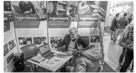
Mehr als 33.000 Besucher kamen auf die Karrierestart 2017. Natürlich interessierten sich viele Schüler auch für den Ingenieurberuf und ließen sich hierzu beraten.

„Was macht eigentlich ein Ingenieur?“ – Das war vermutlich die am häufigsten gestellte Frage, der sich die Standbetreuer der Ingenieurkammer Sachsen und des VDI auf der diesjährigen Karrierestart stellen mussten. Dabei zeigte sich, dass das Interesse junger Menschen am Ingenieurberuf zwar nach wie vor stark vorhanden ist. Jedoch mangelt es den meisten Schülern – verständlicherweise – an konkreten Vorstellungen. Ziel unseres Ingenieurstandes war es, diese Lücke zu schließen und einen Einblick in die Voraussetzungen und in den Werdegang eines Ingenieurs zu geben. Hierfür bot die Karrierestart 2017 das perfekte Umfeld. Mit 500 Ausstellern und mehr als 33.000 Besuchern konnte die Messe Rekordzahlen vermelden. Diese Resonanz schlug sich auch am Stand der Ingenieurkammer und des VDI nieder, so dass die anwesenden Betreuer sich nahezu durchgehend in Beratungsgesprächen befanden.