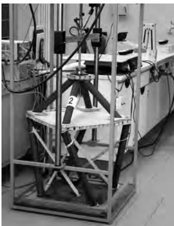
Das Dachtragwerk während des Belastungstests.

Am 23. März 2018 wurden an der Fachrichtung Bauingenieurwesen der Fachhochschule Erfurt die erfolgreichsten und kreativsten Dachtragwerksbauer ermittelt.