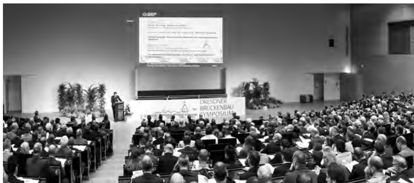
Hörsaalzentrum der TU Dresden zum Brückenbausymposium

eines Objektes werden gegenwärtig verstärkt untersucht. Bei Brückenbauwerken ist eine kontinuierliche Überwachung, auch nach der Inbetriebnahme und besonders bei älteren Ingenieurbauwerken, erforderlich. Die unterschiedlichen Konstruktionsformen von Brücken, wie bewegliche Brücken, Balken-, Hänge- und Schrägkabelbrücken, die Bauverfahren und die Nutzung der verschiedensten Materialien stellen die Grundlage für die Einsatzmöglichkeiten dar.