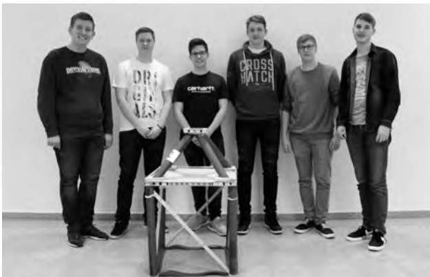
Das Gewinnerteam aus Lengendorf unterm Stein mit ihrer Siegerkonstruktion.

Fachrichtung Bauingenieurwesen der Fachhochschule Erfurt ermittelte die erfolgreichsten und kreativsten Dachtragwerksbauer