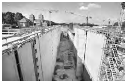
Wie teuer wird dieser Bau werden?

Doch muss das wirklich so sein? Was können die Projektbeteiligten tun, um große Bauprojekte im Rahmen zu halten? Guido Beermann, Staatssekretär im Bundesministerium für Verkehr und digitale Infrastruktur, lud am 19. September zum Dialog zur Beschleunigung von großen Bauprojekten nach Berlin. An der Konferenz nahmen zahlreiche hochrangige Vertreter aus Bauindustrie, Ingenieurbüros, Wissen-