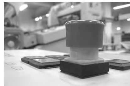
Kommen Sie zum Forum Prüfsachverständige.

Die Teilnahme an der Veranstaltung ist kostenfrei und findet in den Räu-