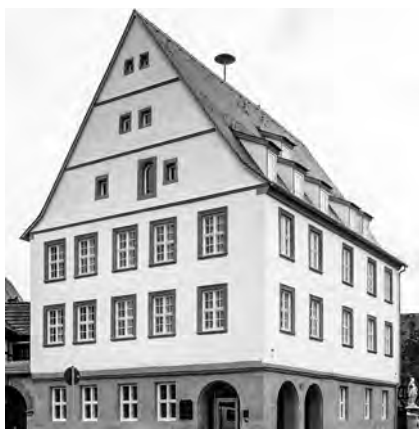
Das Rathaus in Bad Hallstadt wurde mit Gold ausgezeichnet, das Luitpoldbad mit Silber.

Alle Infos über die Gewinner und die Begleitpublikation gibt es online. amt > bayischer-denkmalpflegepreis.de