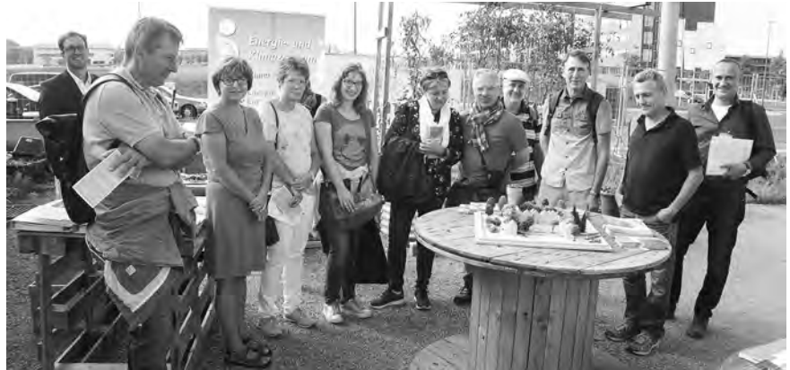
Bei den Rundgängen wurden verschiedene Energiethemen praktisch erklärt.

2013 hat die Bayerische Ingenieurkammer-Bau erstmals den Tag der Energie veranstaltet. Ziel des Aktionstages ist es, interessierte Bürgerinnen und Bürger über Möglichkeiten der Energieeinsparung zu informieren und den Anteil der Ingenieure an der Energiewende zu vermitteln.