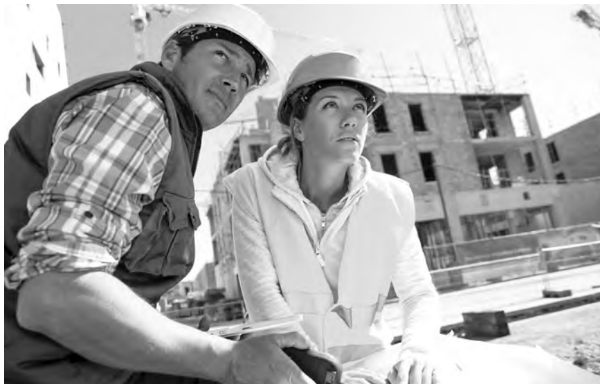
Welche Berufsbezeichnung ist die richtige?

Und wie sieht es mit der öffentlichen Wahrnehmung des Bauingenieurs in der Bevölkerung aus, mit seinem Image? Mit 85 Prozent liegen die Ingenieur-