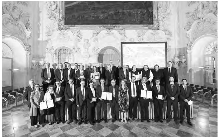
Gruppenbild mit allen Preisträgern.

In der Kategorie öffentliche Bauwerke ging Gold an das Rathaus Hallstadt, Silber an das Luitpoldbad in Bad Kissingen und Bronze an die ehemalige Gastwirtschaft „Zum Goldenen Kreuz“ in Monheim. Bei den privaten Bauwerken bekamen das Gasthaus Baumgartner in Vilshofen und das Fernsemmerhus im Allgäu Silber, die Zisterzienser Abtei Seligenthal in Landshut Bronze.