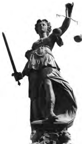
Finanzen geregelt, Freundschaft erhalten.

Weil das Honorar gemäß HOAI auf Basis der Kostenberechnung ermittelt wird und dem Tragwerksplaner eine solche nicht vorliegt, verlangt er von seinem Auftraggeber Auskunft über die anrechenbaren Kosten und Vorlage derselben. Dieser hüllt sich in Schweigen, worauf er eine Schlussrechnung über die Grundleistungen in Höhe von 43.226,08 Euro (zuzüglich später unstrittig gewordener Honoraransprüche für Begleitung der Bauausführung und Wärmeschutznachweis über 3.000,00 Euro) erhält. Der Ingenieur hat dabei die anrechenbaren Kosten der Kostengruppe 300 auf 1 Mio. Euro und der Kostengruppe 400 auf 300.000 Euro