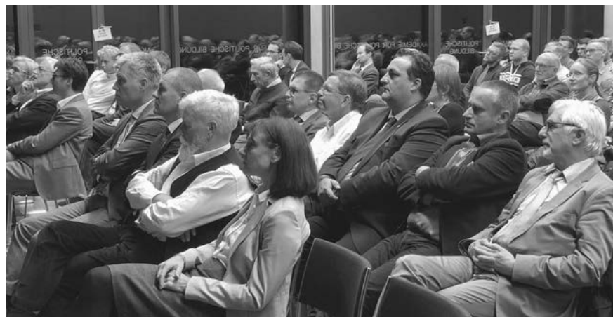
Der Ingenieurberuf hat Zukunft - und noch viel Potenzial, fanden die Teilnehmer der Tagung in Tutzing.