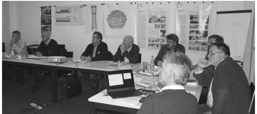
Vorlagen für den Standardschriftverkehr erleichtern die Arbeit.

Seit 2017 stehen insgesamt 16 Vertragsvorlagen als bearbeitbare Word-Dateien und auch als PDF kostenlos zum Download auf der Kammerhomepage bereit. Die Vorlagen für den Standard-Schriftverkehr beinhalten unter anderem Muster für den Abschluss der Leistungsphase 4, die Anforderung eines Terminplanes durch den Auftraggeber sowie Bedenkenanmeldungen.