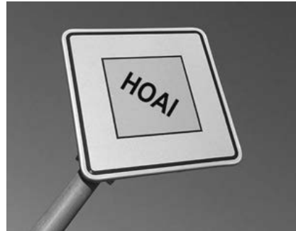
2019 entscheidet der EuGH über die HOAI.

Die Bundesregierung argumentiert, die HOAI diene der Qualitätssicherung, da durch die verbindliche Vorgabe einer Honorarspanne Preisdumping vermie-