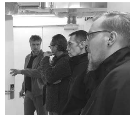
Die Technik nimmt in der Klinik viel Raum ein.

Was an Fläche für die Operationssäle und Sterilisationsräume vorhanden ist, musste in fast gleichem Umfang für die Technikeinrichtungen vorgesehen werden. amt