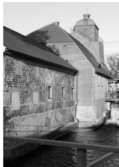
Hüttenwerk Peitz

Ein Blick vom Dach des Hüttenwerkes in Richtung des Kraftwerkes Jänschwalde zeigt, dass wir es verstanden haben mit der Umwelt besser umzugehen. Ja es sind die ehemaligen negativen Schornsteine verschwunden und es rauchen