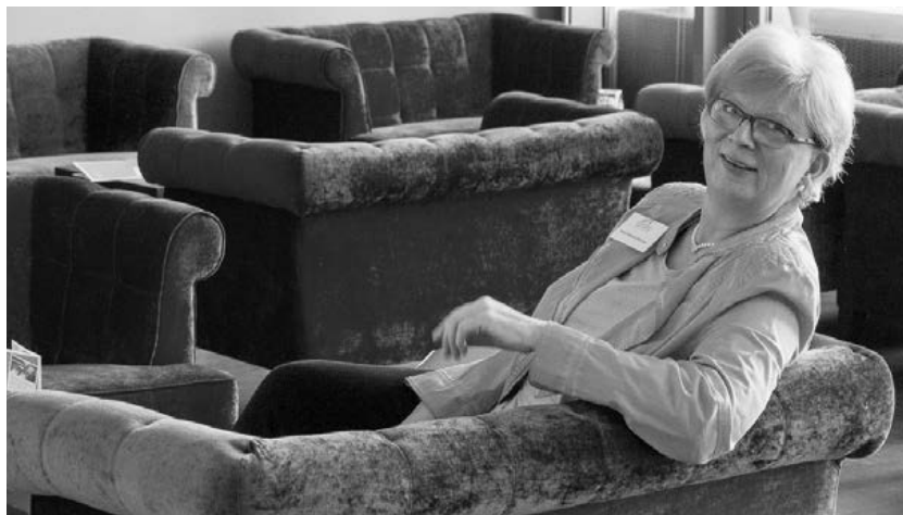
Petra Waese-Krause

Hervorzuheben ist ihr Planungs- und Organisationsgeschick, aufgrund dessen auch in Problemfällen und bei höchster Belastung stets sehr gute Ergebnisse erbracht wurden.