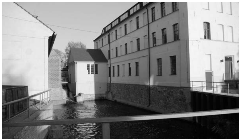
Hüttenwerk Peitz

Neben den technischen Anlagen und Gebäuden ist noch eine besondere ingenieurtechnische Leistung der damaligen Zeit zu bewundern, der Hammergraben . Ohne den Hammergraben würden alle technischen Anlagen in den Gebäuden