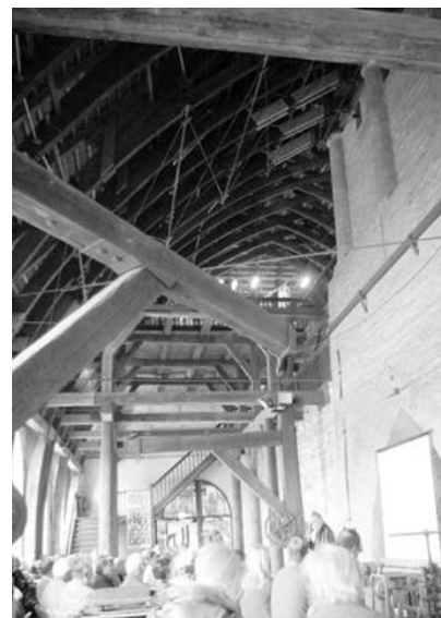
Hüttenwerk Peitz

nur die Kühltürme, welche gerne in Diskussionen als dampfende Schloten bezeichnet werden, aber hier kommt nur ungefährlicher Wasserdampf raus.