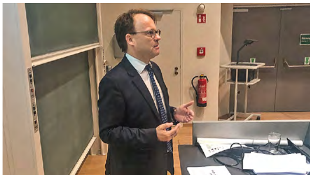
RA Schugardt informiert unter anderem über die Auswirkungen des EuGH-Urteils auf künftige Ingenieur- und Architektenverträge.

dem Preisrecht für die Berechnung der Entgelte für die Leistungen der Architekten und Ingenieure, soweit sie durch Leistungsbilder oder andere Bestimmungen der Verordnung erfasst werden. Bereits 2006 trat die