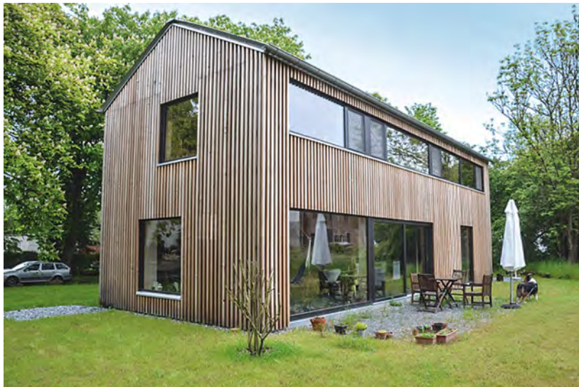
Neubau eines Wohnhauses in Kemnitzerhagen

Alle neun von der Jury ausgewählten Favoriten wurden ausgezeichnet. Für hohen architektonischen Anspruch