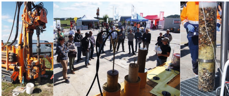
Teilnehmer des Seminars "Grouting Fundamentals & Current Practice" bei "Hands on Demonstrations".