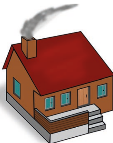
Nur bedingt energieeffizient: alte Häuser

Ebenfalls mangelhaft: sofern die Nutzung regenerativer Energien nicht möglich ist, wird als „Ersatzmaßnahme“ eine