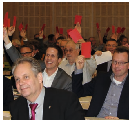
Die Vertreterversammlung verabschiedet den Haushaltsplan 2020.

Der Ausschuss Haushalt und Finanzen nimmt Stellung zum Haushaltsplan 2020. Die Vertreterversammlung folgt einstimmig der Empfehlung des Ausschusses, den Haushaltsplan in der vorliegenden Fassung zu verabschieden.