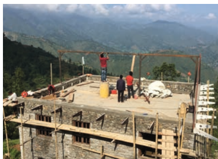
Der Wiederaufbau in Nepal dauert an.