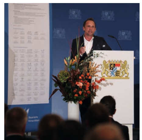
Umweltminister Thorsten Glauber beim Festakt.

Die Partner der Klima-Allianz haben sich zum Ziel gesetzt, den Klimaschutz als gesellschaftliche Aufgabe bayernweit zu etablieren.