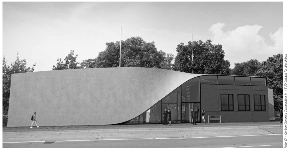
Der Standort des CUBEs (hier als Visualisierung) steht schon fest: Ecke Einsteinstraße / Zellescher Weg in Dresden.