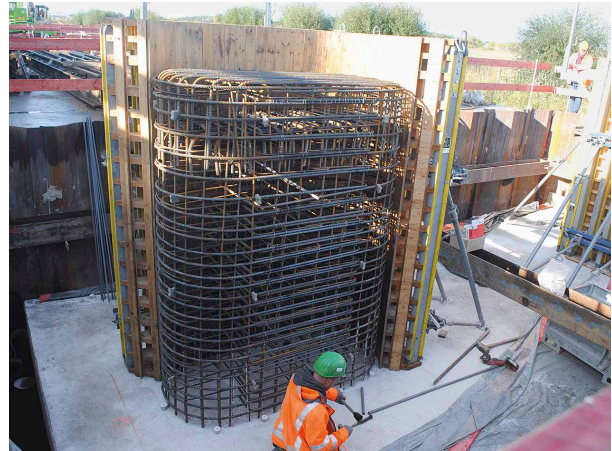
Die Bauarbeiten beeindruckten.