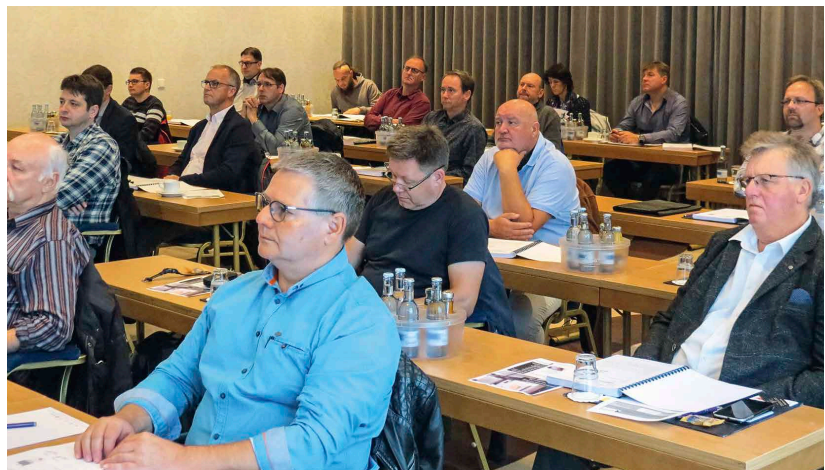
Ausgebucht: Das Ingenieurforum fand großen Anklang