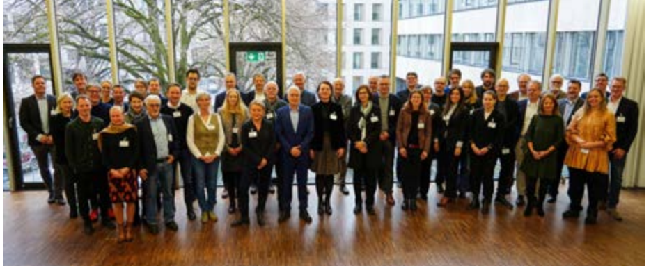
Auftaktveranstaltung zum Gebäudety-p-e im Bayerischen Bauministerium.

Der „Gebäudety-p-e“ geht zurück auf eine Initiative der Bayerischen Architektenkammer, der sich auch die Bayerische Ingenieurekammer-Bau angeschlossen hat. Im Sommer 2023 hat nun das Bayerische Bauministerium dafür Artikel 63 BayBO