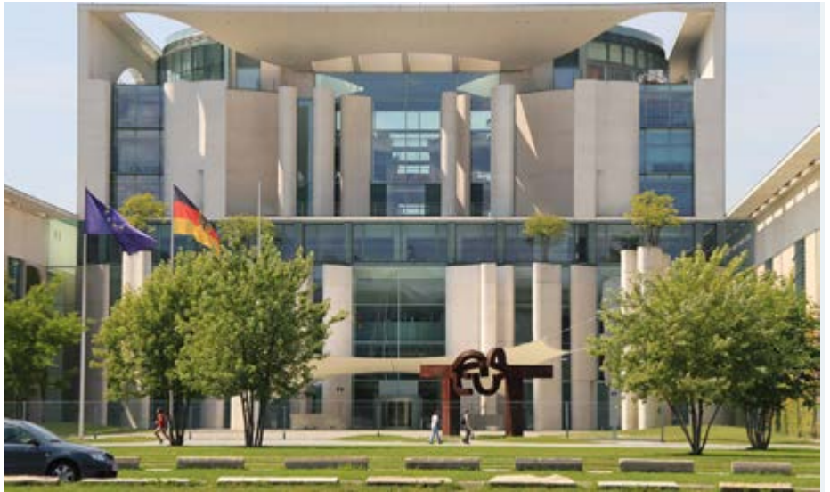
Die Kammern haben einen offenen Brief ans Bundeskanzleramt geschickt.

Bei einem Auftragsrückgang von bis zu 80% im Wohnungsbau wird deutlich,