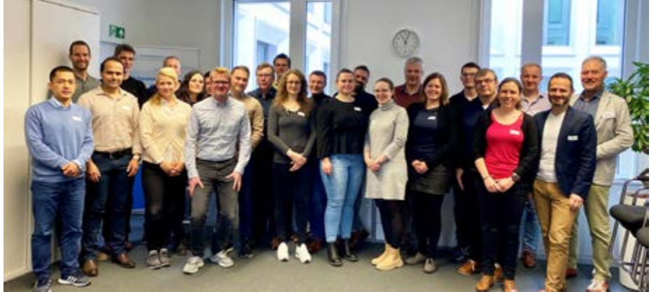
Gute Stimmung beim Start des neuen Lehrgangs der Ingenieurakademie Bayern.

Der Schwerpunkt der neuen berufsbegleitenden Fortbildung liegt auf der Vermittlung von speziellem Eisenbahnwissen.