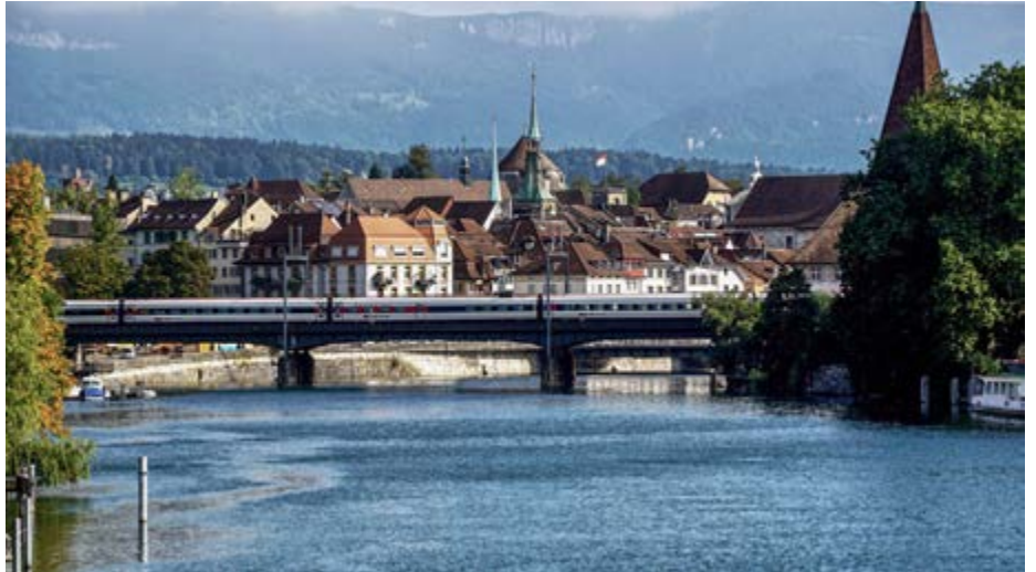
Wasser- und Schienenverkehr in Kombination.