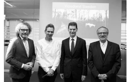
Die Referenten der Ausstellungseröffnung.