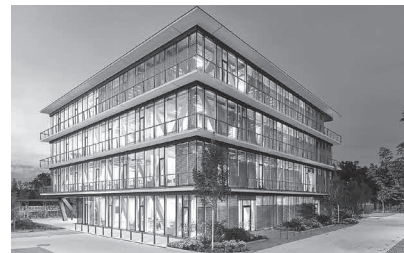
Bild oben © Detlef Gradl-Schneider Bild unten © Scope Architekten