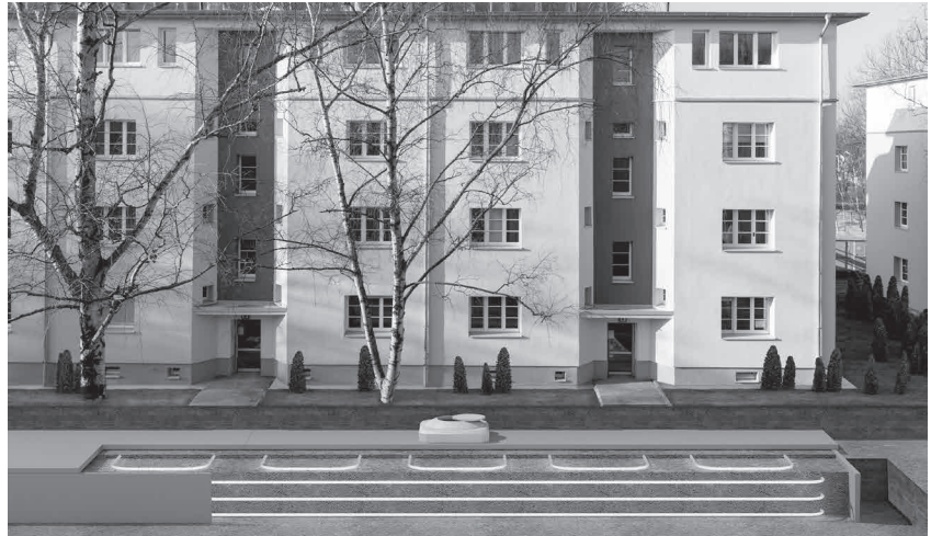
M. Scholle © deematrix Energiesysteme GmbH, Animation S. Kleptcha

Hier besteht also ein großes Energieeinsparpotenzial, das über drei Ansätze zur Verringerung des Energieverbrauchs beeinflusst werden kann: