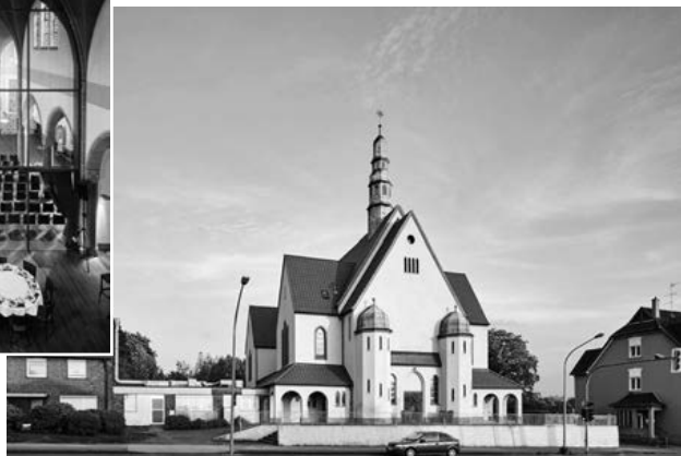
St. Bernardus, Oberhausen

Weitere Infos im Web unter www.zukunft-kirchen-raeume.de