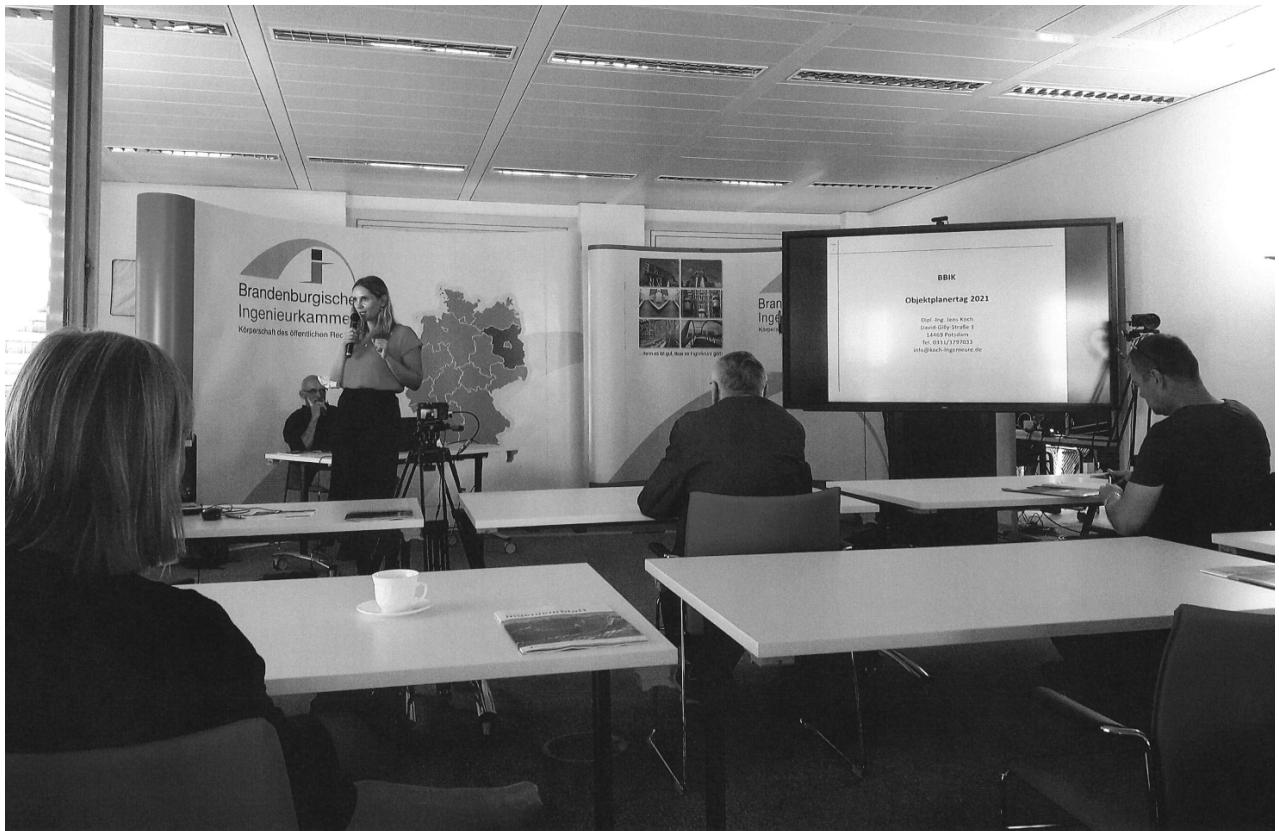
Digitaler Objektplanertag direkt aus dem Studio der BBIK