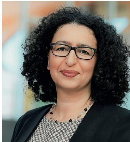
Univ.-Prof. Dr.-Ing. Lamia Messari-Becker fordert eine grundsätzlich andere Baupolitik.

Wir müssen wetterextremsensibel bauen. Klimaanpassung adressiert mehrere Ebenen - Bauwerke, Außenraum, Stadt, Landschaft und Infrastruktur - sowie unterschiedliche Wetterextreme (Hitze, Starkregen, Hochwasser, Dürre,