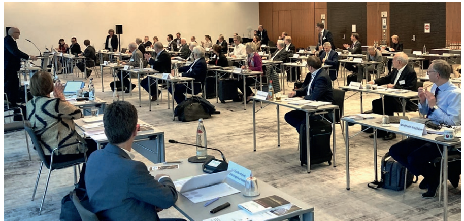
Die Delegierten bei der 68. Bundesingenieurkammer-Versammlung (BKV) im Berliner Novotel Hotel am Tiergarten.