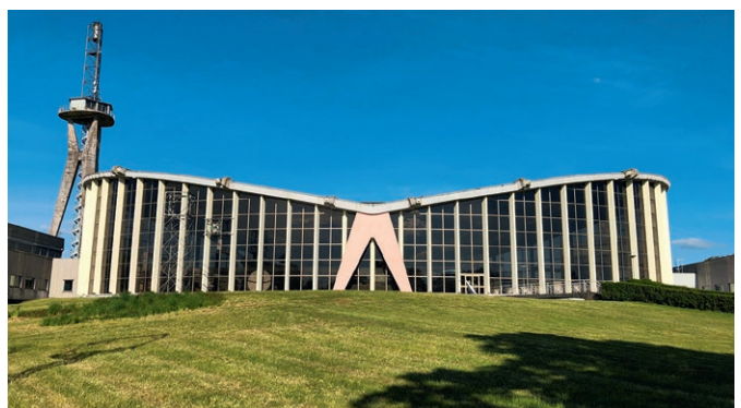
Die ehemalige Sendehalle von Radio Europe 1 im saarländischen Berus ist das neueste „Historische Wahrzeichen der Ingenieurbaukunst in Deutschland“.