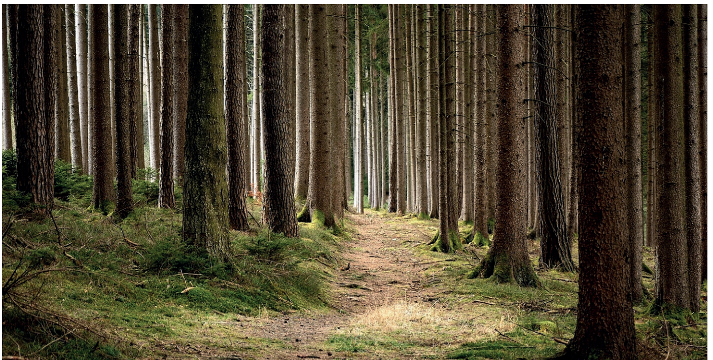
Klassische Monokulturen werden in der Forstwirtschaft mehr und mehr durch hitzeresistentere Arten ersetzt.

Axel Conrads: Wir verbrauchen in Deutschland jährlich rund 50 Mio. m 3 Beton. Die Sägeindustrie produziert im Jahr ca. 35 Mio. m 3 Holz, wir haben im Wald einen jährlichen Zuwachs von