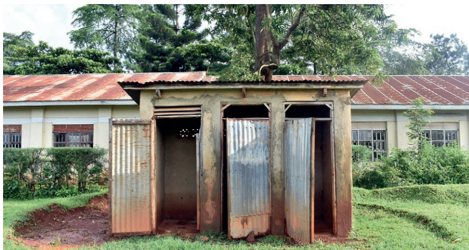
Toilettengebäude in Uganda

Die Tabelle rechts zeigt eine kleine Aus-