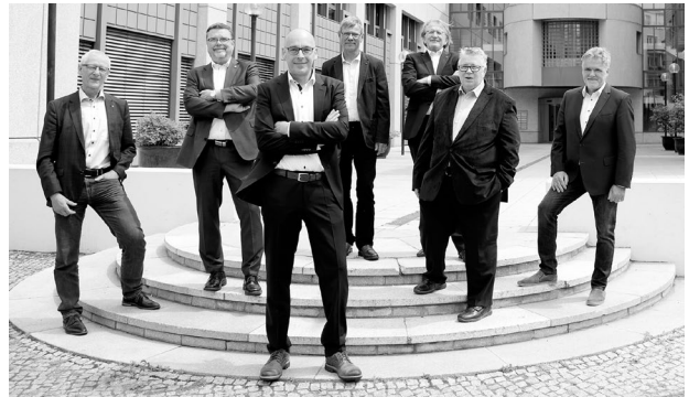
Vorstand der BBIK

Das Thema Baukultur wurde bereits 2021 stärker von uns in den Fokus gerückt und so wird es auch 2022 sein. Besonders im Hinblick darauf, dass das Themenjahr von Kulturland Brandenburg 2023 unter diesem