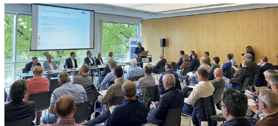
Das Interesse der Kammermitglieder war groß

Ministerpräsidentin Rehlinger zeigte sich zuversichtlich, dass in den kommenden Jahren ausreichend Gelder für das Bauen in den unterschiedlichsten Infrastrukturbereichen zur Verfügung stehen werden und betonte die zentrale Rolle der saarländischen Ingenieurbüros bei der Bewältigung dieser Herausforderung: „Deshalb ist es umso wichtiger, dass die saarländischen Ingenieurbüros gut aufgestellt sind, über eine ausreichende Anzahl an Fachkräften verfügen und mithelfen, das Geld zu verbauen. Wenn letzteres gelingt, hilft das gleich mehrfach: bestehende Arbeitsplätze werden erhalten und neue geschaffen. Gleichzeitig bringt es Wertschöpfung in die Region – und das stärkt unseren Wirtschaftsstandort nachhaltig.“