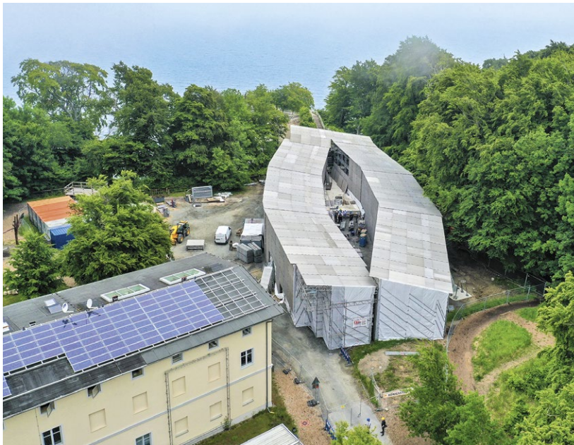
Noch ist der Königsweg eingehaust. Besonders interessant wird der Vorschub der Brückenkonstruktion.