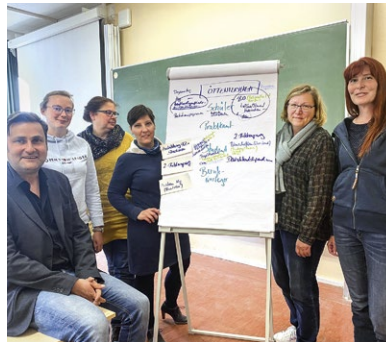
Bei der Strategieentwicklung wurden vom Ausschuss alle Ideen/Maßnahmen gesammelt.