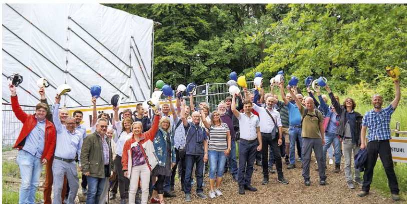
Gute Stimmung bei den Teilnehmern. Umfassende Informationen und Bautagebuch zum Projekt unter: https://koenigsweg.koenigsstuhl.com/