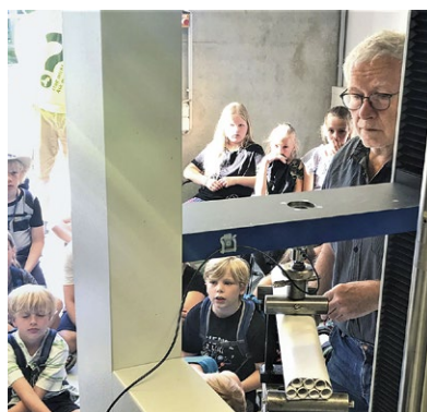
Bei der Messung vor Ort können die Schüler mitfieberten.

Etwa 300 Schülerinnen und Schüler aus Neukloster, Ribnitz-Damgarten, Sternberg, Schwerin und natürlich Wismar hatten ihre 49 Papierbrücken an die Hochschule Wismar geschickt oder persönlich abgegeben. Vorangegangen war der Brückenbau auf ganz unterschiedliche Weise. Für manchen Teilnehmenden war es Antrieb, die theoretischen Kenntnisse in eine spezielle praktische Anwendung umzusetzen. Denn einige Lehrerinnen und Lehrer hatten die Aufgabe zum Bau einer Papierbrücke in den Unterricht oder Wahlpflichtkurs eingebaut. So konnten sich die Schüler einmal wöchentlich ihrer Idee widmen.