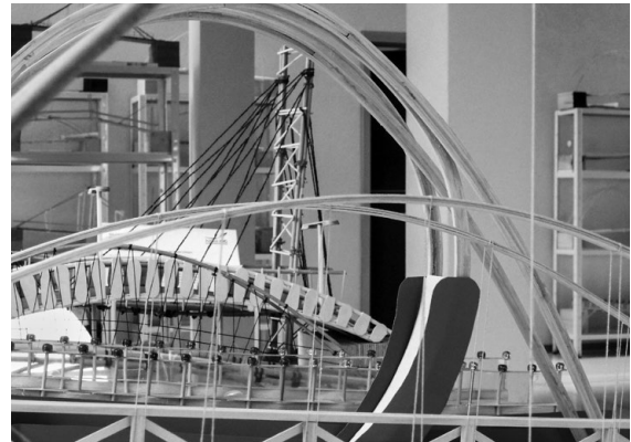
Insgesamt 75 Modelle in zwei Alterskategorien wurden eingereicht – und die Dokumentationen zeigten: Es wurde viel getüftelt!

ausragendes Design, ein besonders innovatives und nachhaltiges Beleuchtungskonzept oder ein „kleines Gesamtkunstwerk“. Sie untersuchte im Detail das Tragwerk, prüfte, ob ein Modell tatsächlich in der Realität umsetzbar wäre, wie sich der Materialaufwand darstellte. Kurzum: Sowohl Funktion als auch Form spielten eine Rolle – und in der letztlichen Entscheidung, die in diesem Jahr ausgesprochen schwerfiel, ging es schließlich auch um Pfiffigkeit und Sorgfalt.