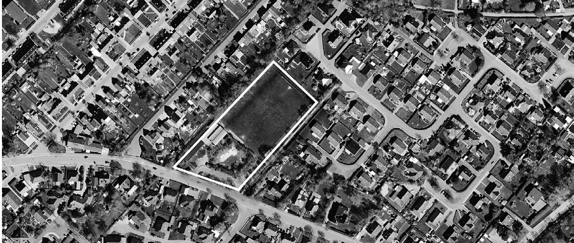
Luftaufnahme des Wettbewerbsgebietes

Hochbaulicher Realisierungswettbewerb mit freiraumplanerischem Anteil „Neubau Grundschule West mit Sporthalle“ | Stadt Brunsbüttel