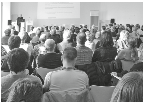
Fast bis auf den letzten Platz besetzt – der Vortragssaal der Kieler Kunsthalle

Uns ist bewusst, dass auch ein 20 Mio.-Projekt nicht mit 50 Mitarbeiterinnen und Mitarbeitern geplant wird; auch in großen Büros arbeiten nur 3 bis 4 Personen am Projekt. Das führt zu Frust bei den kleinen und mittleren Büros, die solche Bauaufgaben ebenfalls souverän lösen können. Zwar ist das Bauen in den letzten Jahrzehnten immer komplexer geworden, und natürlich fordert der Auftraggeber den Nachweis von Erfahrung. Doch eine Chance, wie sie Meinhard von Gerkan hatte – als Quasi-Anfänger den Flughafen Tegel per Wettbewerb zu gewinnen und ihn dann auch