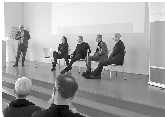
Für Austausch und Diskussion war reichlich Zeit eingeplant – der umfassende Dialog war das Ziel der Veranstaltung! | AIKS-H