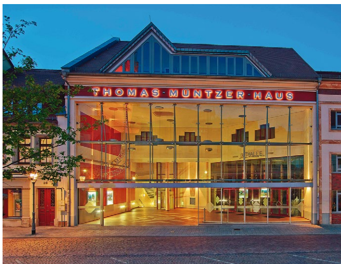
Wir freuen uns auf Ihre Teilnahme am 19. Oktober in Oschatz!