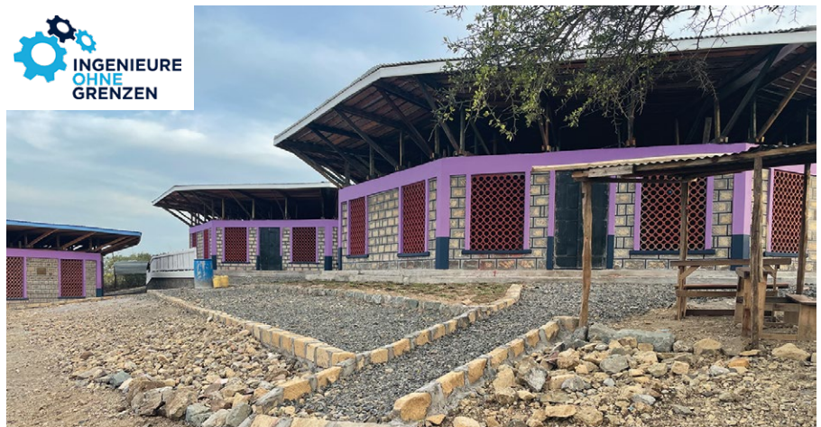
Drei Schulgebäude konnten dank der Unterstützung der Regionalgruppe Leipzig errichtet werden.

Parasiten belastet. Sauberes Wasser könnte gegen eine entsprechende Gebühr bestellt und per Tankwagen geliefert werden. Aufgrund der vergleichsweise hohen Kosten wird jedoch diese Option nicht genutzt.