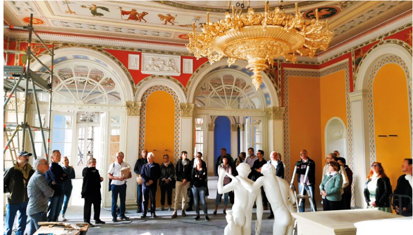
Farbenbracht und Prunk: Die Säle sollen wieder in den Landesfarben erstrahlen.

In den Jahren 1840-42 gestaltete der Strelitzer Landesbaumeister Friedrich-Wilhelm Buttler die als Winterlager für die tropischen Pflanzen erbaute Orangerie von 1755 auf Empfehlung von Karl Friedrich Schinkel und Christian Daniel Rauch zu einem prachtvollen Gartensalon um. Drei Festsäle sind in den Landesfarben blau, gelb und rot gehalten. Sie beherbergen Kopien antiker Skulpturen und die herzogliche Antikensammlung. Ab den 1920er Jahren erfolgte eine öffentliche gastronomische Nutzung bis in die 90er Jahre.