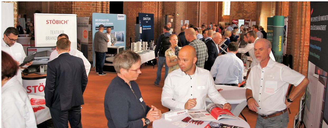
Die Fachausstellung ist ein guter Grund für persönliche Anwesenheit.