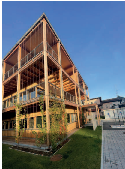
Konzepte zum sommerlichen Wärmeschutz bei der Bezirksbauernkammer in Hallein (AT).

Eine solche Vielfalt an innovativen Holzgebäuden auf kleinstem Raum wie im B&O Park in Bad Aibling gibt es wohl kein zweites Mal in Deutschland. Besonderes Highlights bei der Besichtigung des Parks waren das zweigeschossige Parkhaus in Holzbauweise und die Forschungshäuser zum Thema des einfachen Bauens. Der Mut der B&O Gruppe zum gebauten Experiment war beeindruckend und inspirierend.