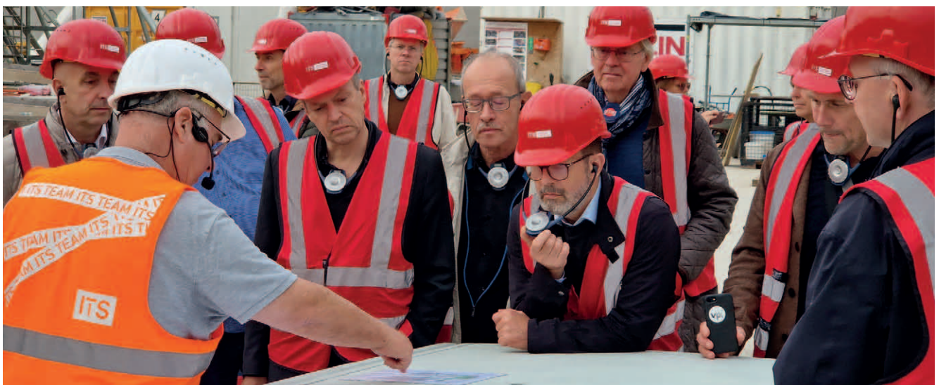
Die Großbaustelle im Stuttgarter Stadtzentrum bietet zahlreiche Möglichkeiten, Einblick zu nehmen.

zum Ankurbeln der Baukonjunktur tun können, müssen sie jetzt schleunigst auf den Weg bringen, insbesondere auch im Musterlände Baden-Württemberg.