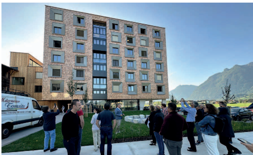
Das 7-geschossige Internatsgebäude in Kuchl.

Am Olympiacampus der Technischen Universität München konnte das in einer vorigen Ausgabe von INGBW aktuell bereits vorgestellte spektakulär auskragende Vordach in natura bestaunt werden. Aber nicht nur das Vordach, sondern auch weitere Aspekte