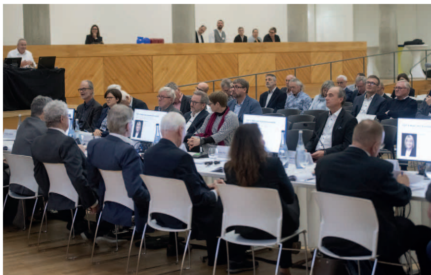
Der Saal der Staatsgalerie war erneut Schauplatz der Versammlung.