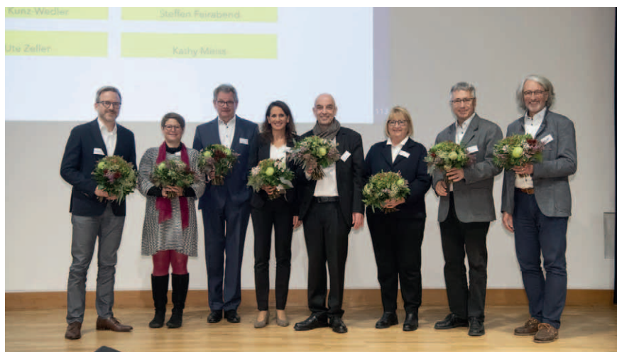
Ein Blumenstrauß zur Wahl: der frisch gekürte Vorstand.