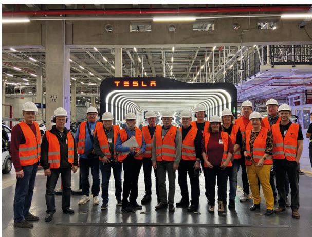
Teilnehmende der ersten Gruppe

TESLA ist bekannterweise ein amerikanisches Unternehmen. Ihre Gewinne kommen also vorrangig deren Eigentümern zugute. Trotzdem meine ich, dass die Ansiedlung von TESLA insgesamt in unserer Region zu begrüßen ist. Sie wirkt der seit 1990 auch in Ostbrandenburg zu verzeichnenden Deindustrialisierung entgegen, verbunden mit einer Aufwertung des regionalen Images, Ansiedlung neuer (auch mindestens 50% deutscher) Arbeitskräfte mit gleichzeitiger Ausstrahlung durch wachsenden Bedarf von Leistungen der Zulieferindustrie, des Handwerks sowie der Dienstleistungsbranche und des Wohnungsbaus. Gleichzeitig entspricht die Produktpalette der Fabrik der deutschen Strategie zur schrittweisen Erweiterung der E-Mobilität.