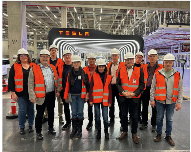
Teilnehmende der zweiten Gruppe

Nach dieser Einführung folgte eine ausführliche Besichtigung der Fertigungsstraße zum Modell Y über einen etwa 3 km langen Rundgang, der die gewaltige Dimension dieses seit 2019 mit der örtlichen Planung begonnenen Großvorhabens vermittelte. Beeindruckend war die Sauberkeit und Organisation der Produktionsstätten, in denen es von Robotern und Automaten nur so wimmelte. Dazwischen herrschte geschäftiges Treiben der Beschäftigten, die die weitgehend automatisierten Prozesse überwachten bzw. die Maschinen steuerten. Die Führung endete im sogenannten Lichttunnel, wo die