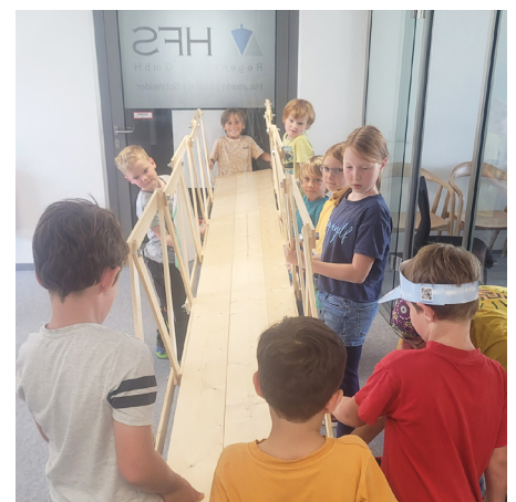
Künftige Brückenbauer:innen bei der Arbeit.