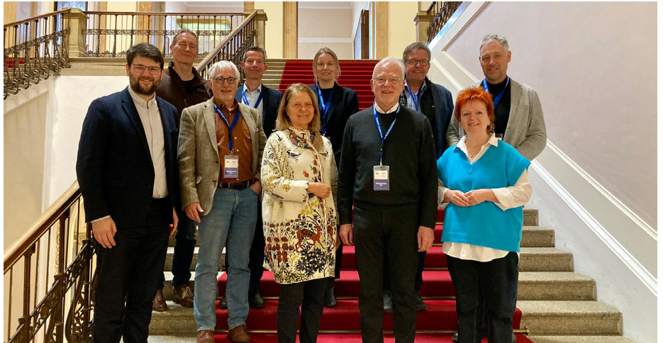
Der Baylka-Vorstand im Gespräch mit der Landtagsfraktion von Bündnis90/Die Grünen.