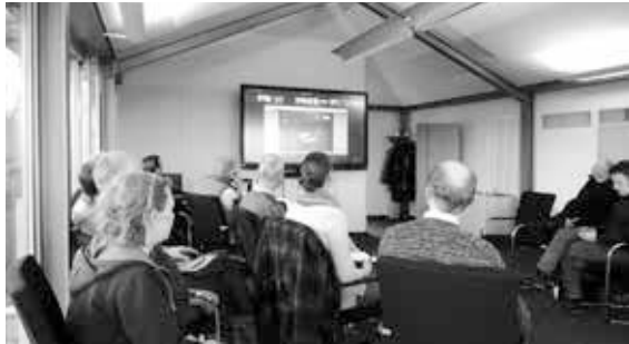
Der Hauptausschuss vor Ort – und rund 70 Kolleginnen und Kollegen online dabei – ein schöner Start des neuen Formats!

Im Rahmen der Sitzung am 03. März ging es unter anderem um Künstliche Intelligenz in Planung und Architektur. Der Referent Philipp Eichstädt (Studio Eichstädt Gresser, Berlin) berichtete von umfangreichen Recherchen und „Gehversuchen“.