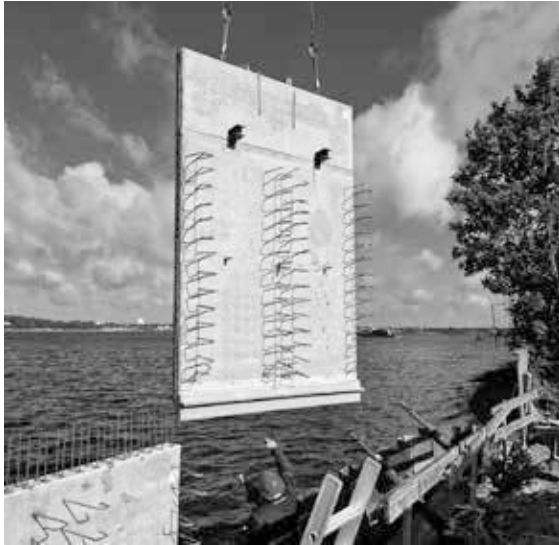
Basaltfaserstabbewehrung bei Instandsetzung Uferwand Hasselfelde

Donnerstag, 19. Juni 2025 | Fachhochschule Kiel, Institut für Bauwesen