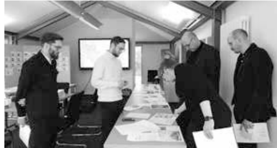
Die Jury wählte aus 31 Einreichungen diejenigen Projekte aus, die der Öffentlichkeit im Rahmen des Aktionswochenendes vorgestellt werden.

Wir bedanken uns herzlich bei den Jurymitgliedern, die am 13. Februar alle 31 Einreichungen sichteten