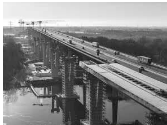
Mithilfe des Taktstiegeverfahrens wächst das imposante Bauwerk Stück für Stück.

Sie möchten einen Blick hinter die Kulissen eines der bedeutendsten Infrastrukturprojekte Norddeutschlands werfen? Dann nutzen Sie die einmalige Gelegenheit, die Baustelle der neuen Rader Hochbrücke zu besichtigen! Erfahren Sie aus erster Hand, welche technischen Herausforderungen der Neubau mit sich bringt und wie das imposante Bauwerk bis 2030 in mehreren Bauphasen entsteht.