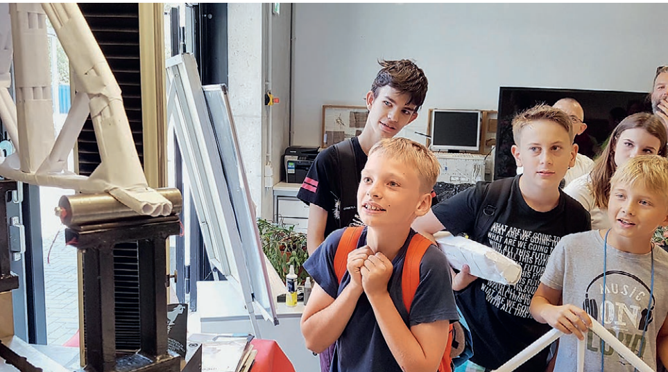
Die Spannung steigt: Wie viel Last hält die Brücke aus?

Immerhin ein Gutes hat die digitale Veranstaltung. „Wir hoffen, dass sich MV-weit Schulen beteiligen und